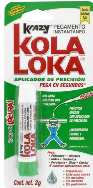
Kola Loka® Aplicador de Precisión 2g