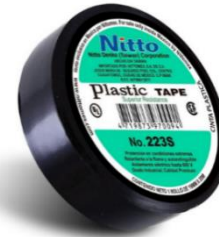
Cinta Nitto No. 21 de cloruro de polivinilo flexible de plomo

Reconocida como la mejor calidad para aplicaciones generales y trabajos de alambrado eléctrico. Provee un aislamiento y adhesividad excelente, así como resistencia a temperaturas extremas.