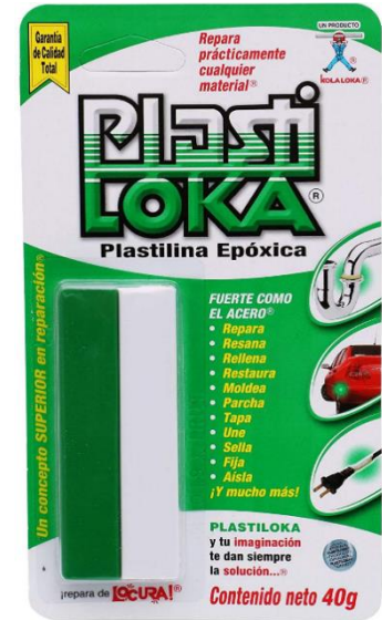
PlastiLoka® 20g Plastilina Epóxica

PLASTILOKA y tu imaginación te dan siempre la solución...®