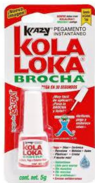
Kola Loka® Pegamento instantáneo de cianoacrilato

PLASTILOKA y tu imaginación te dan siempre la solución...®