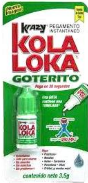
Kola Loka® Goterito 3.5g