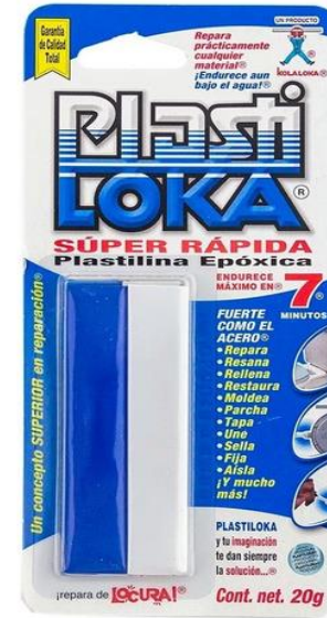
PlastiLoka® Súper Rápida 20g Plastilina Epóxica Endurece máximo en 7 minutos®.